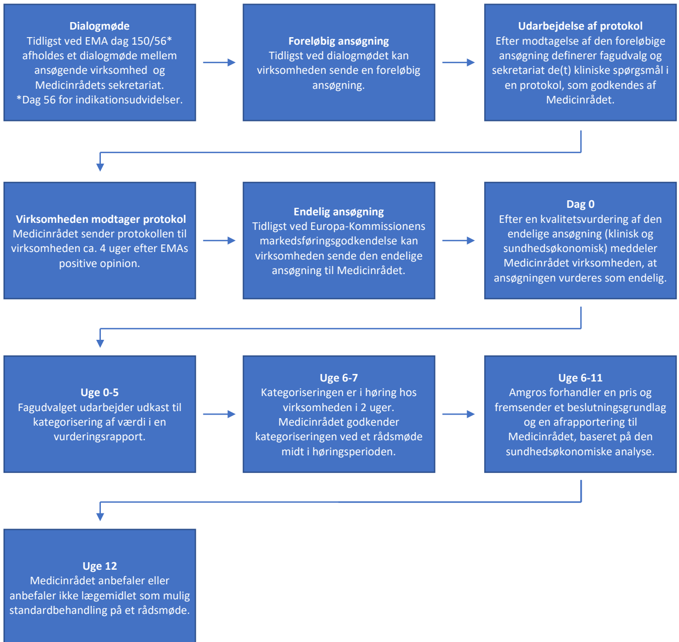
Figur 1. 12-ugersproces

Her ses en overordnet tidsramme for 12-ugersprocessen. Denne er betinget af datoer for rådsmøder, som fremgår af Medicinrådets hjemmeside: